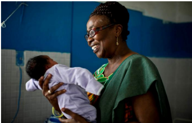
Libéria

MCSP espère que les directives opérationnelles des SMR aideront les intervenants nationaux, les gestionnaires du programme et les partenaires à faire avancer les efforts de mise en œuvre et l'apprentissage dans divers contextes. MCSP a travaillé avec les intervenants locaux au Nigéria et au Guatemala pour appliquer les premières phases des directives opérationnelles et contribue à la conception, à la mise en œuvre et au suivi d'interventions visant à améliorer les soins centrés sur la personne et à réduire les mauvais traitements dans le cadre du réseau multipays de l'OMS sur la qualité des soins pour améliorer la SMN ( www.qualityofcarenetwork.org ).